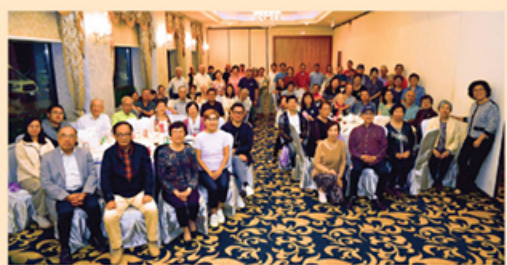
“舉杯邀月同歡慶，加港漢友共此時”探訪團與加東校友相聚共賞中秋明月。