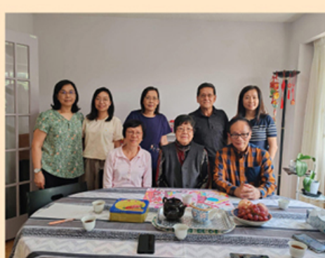
探訪第七屆廖錦屏，其家族枝葉茂盛，有二十多位漢華子弟，堪稱大戶人家。