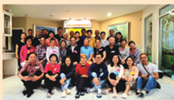
溫哥華校友為探訪團舉行POTLUCK盛宴，大家閒話家常親切溫馨。