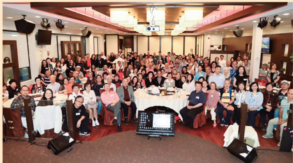
百多位漢友及親友出席加東校友會慶祝12周年會慶暨中秋聯歡晚宴場面熱鬧