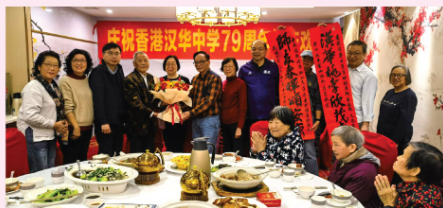
出席聚會常理與內地校友合照