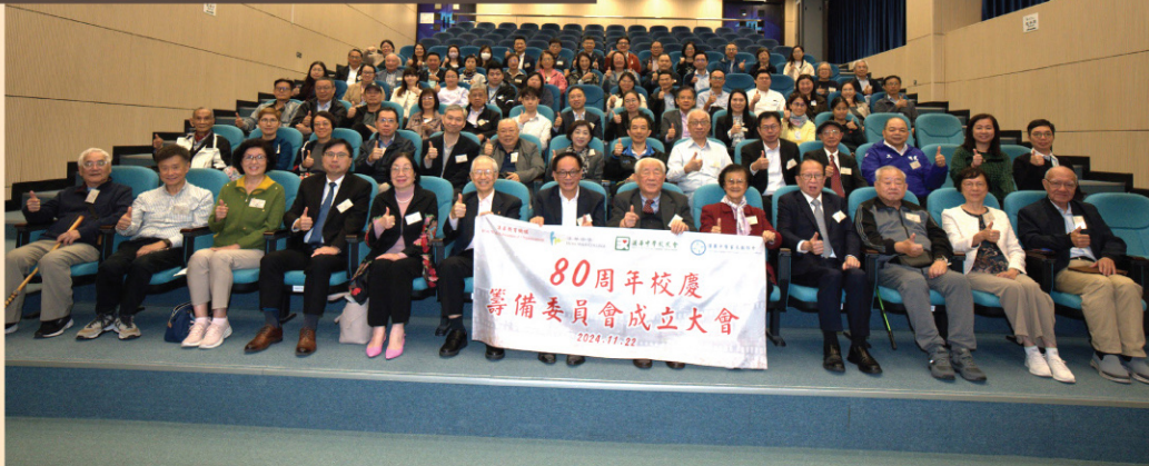
2024年11月22日80周年校慶籌備委員會宣佈成立