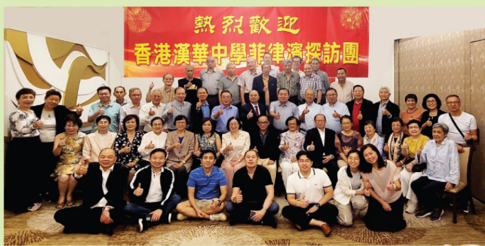
菲律賓校友會歡迎晚宴大合照