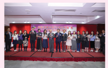
學校行政團隊、家長教師會祝酒