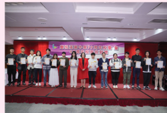
校董會頒發「升學優異獎」