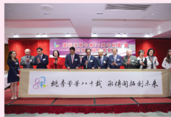
八十周年校慶標語

圍獎和大抽獎的環節更是笑聲和歡呼聲交織在一起，充滿了整個會場。祝酒環節將氣氛推向了另一個高潮，信託局、校董會、行政團隊、家長教師會以及校友會代表依次舉杯，共祝漢華中學的未來更加輝煌。每一聲「賀校慶」都蘊含著深深的祝福和期待，正如「承傳開拓創未來」所表達的那樣，漢華中學將繼續