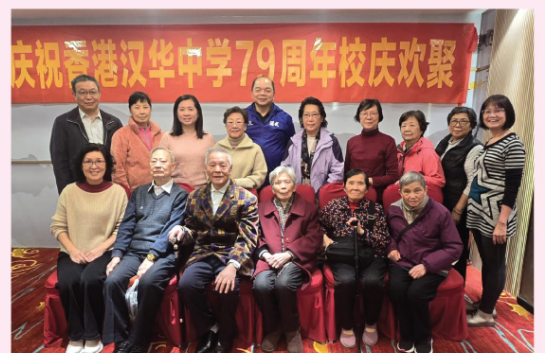
出席聚會常理與內地校友合照