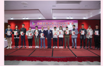
校友會頒發「升讀大學獎勵計劃」得獎者