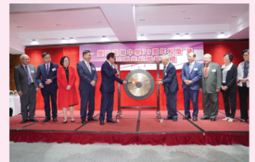
校慶籌備委員會以鳴鑼儀式隆重宣佈校慶年正式開始