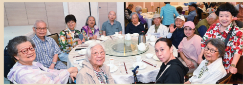
日校第 8 屆校友