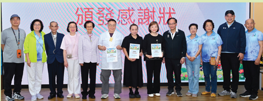
校友會領導致送感謝狀予按摩團團長、彩繪師代表、健康食品代表。