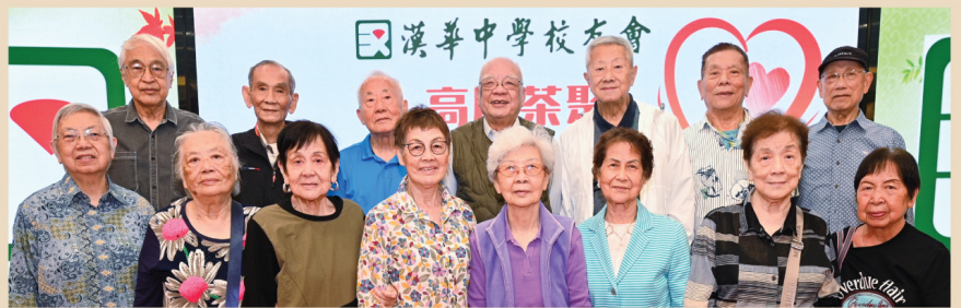
日校第 9 屆校友開心相聚