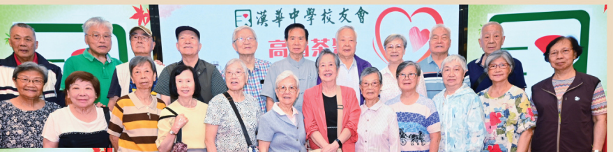
日校第 11 屆校友合照