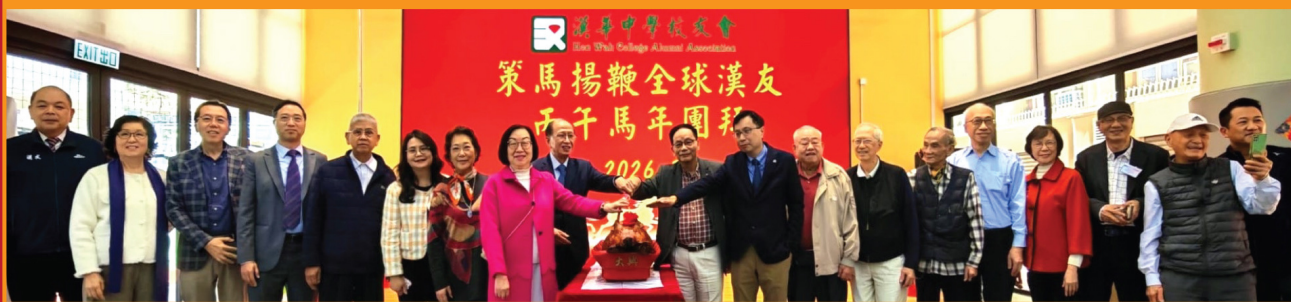
丙午馬年團拜活動進行切金豬儀式