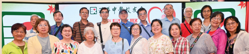
夜校第 12 屆校友合照