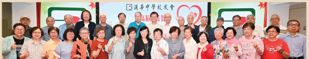
日校第 18 屆校友大合照