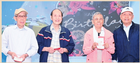
日校第 5 屆及第 7 屆出席壽星