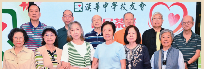
日校第 14 屆校友合照